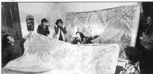
L'association CTE-CRH a travaillé depuis le début de l'année autour du thème de théâtre-forum et de l'éco-citoyenneté.

U TILISER le théâtre comme vecteur pour faire passer des messages sur l'environnement et l'éco-citoyenneté. C'est la méthode utilisée depuis le début de l'année par Méditerranée 2000, qui coordonne une série d'actions dont le point d'orgue va être, demain, samedi 10 décembre , au Plan-de-Grasse, le festival Éco-Forum. Depuis plusieurs mois, dans différents quartiers de la ville, des citoyens participent à des ateliers portés par des associations locales. Ils y travaillent le théâtre-forum, par le biais duquel ils mettent en scène des messages de sensibilisation et de prévention en rapport avec l'environnement et le cadre de vie. Une forme nouvelle de démocratie participative, qui offre des espaces de réflexion originaux et des passerelles entre réflexion et action.